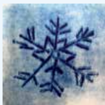
Práce záruk výtvarného oboru ZUŠ Velké Opatovice

Z celého srdce přejeme příjemné prožití svátků vánočních a úspěšné vykročení do nadcházejícího roku 2024.