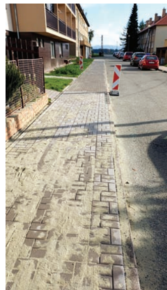
Oprava chodníku na ul. E. Ušela