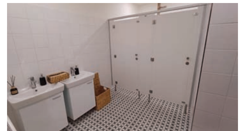
Sociální zařízení v zámeckém sále