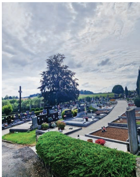
Hřbitov - chodníky