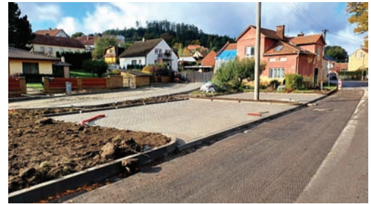
Oprava ul. Sokolská