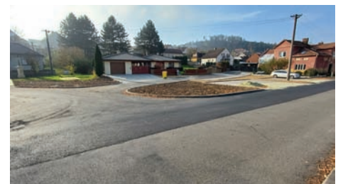
po rekonstrukci ul. Sokolská