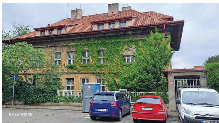
Galaxy A33 5G